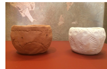
Reproduction de poterie classe cm1